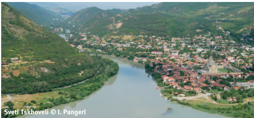
Sveti Tskhoveli

Durch wunderschöne Berglandschaften und Schluchten gelangten wir nach Borjomi, die Stadt ist durch ihr Mineralwasser und den ehemaligen Zarensitz bekannt. In dieser Gegend ist auch ein wichtiger Wirtschaftszweig beheimatet, die Samenproduktion für Nordmann-tannen, einer der beliebtesten Christbäume. Unser Tagesziel war Vardzia, nahe der türkischen Grenze: Höhlen mit Wohnräumen und einer Kirche mit Fresken aus dem 12. Jahrhundert, über Leitern zu besuchen. Sie wurden erst sichtbar durch einem Felssturz nach einem Erdbeben. Retour in die Hauptstadt fuhren wir über mehrere Hochflächen entlang der Grenze zu Armenien und durch eine von Seen geprägte Almland-