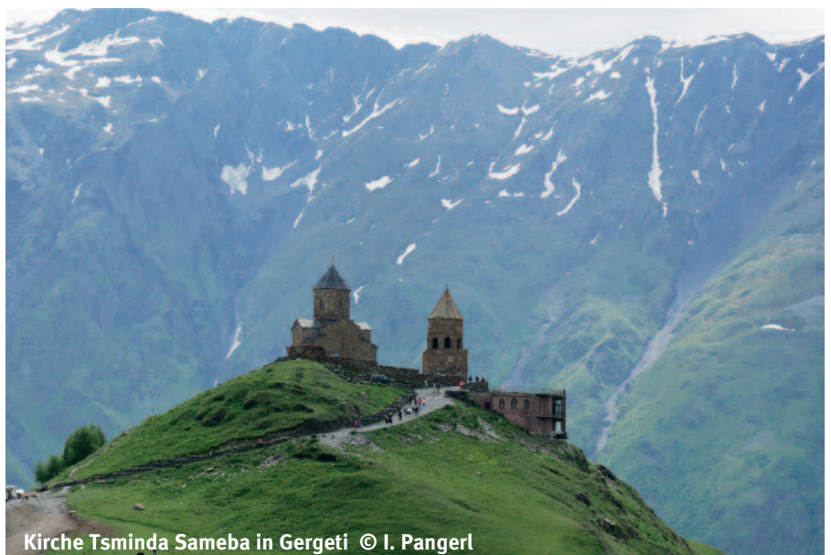
Kirche Tsminda Sameba in Gergeti

Einen ersten Ausflug machten wir in den kleinen Kaukasus. Unweit der Hauptstadt liegt einer der bedeutendsten Wallfahrtsorte des Landes, wo die Heilige Nino als Schutzpatronin verehrt wird. Nino, eine gebürtige Syrerin, brachte im 4. Jahr-