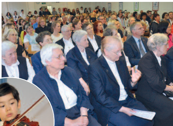
Die SC-Schwestern beim Festakt