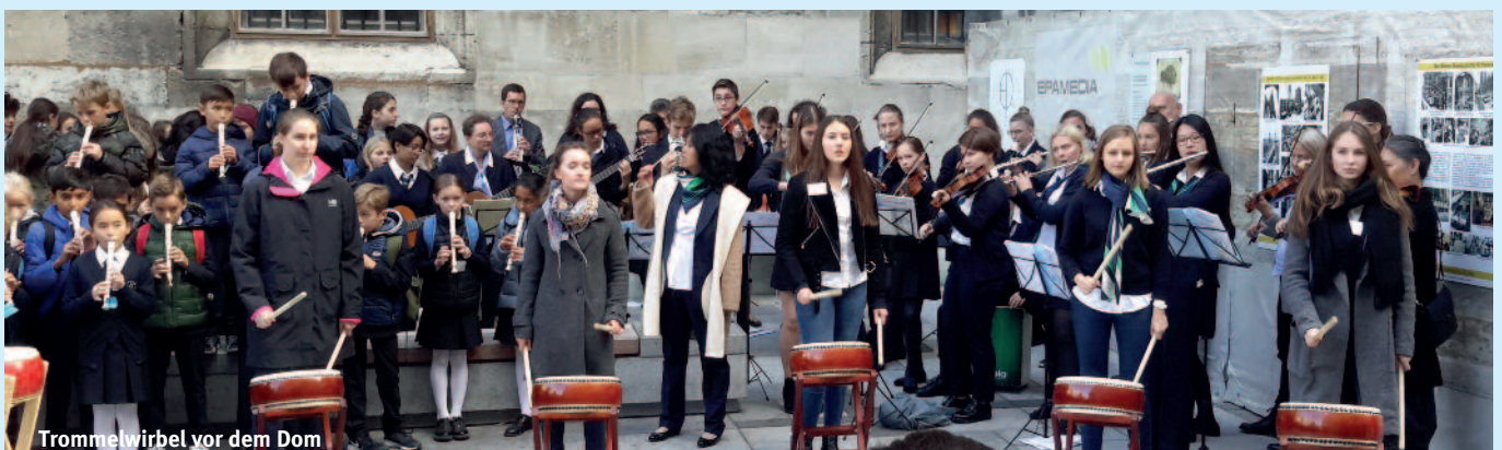
Trommelwirbel vor dem Dom