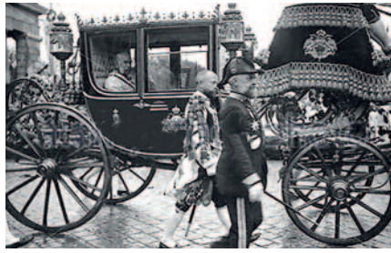
Kaiserkutsche am Eucharistischen Weltkongress

Schon die Vorbereitungen werden minutiös geschildert, sogar das Wort des Kaisers: „Franz ( Franz Ferdinand ), das muss ein Triumph werden! Alles, was das Kaiserhaus an Pomp aufbieten kann, soll aufgebieten werden“ wiedergegeben.