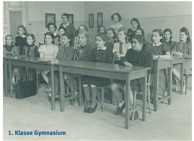
1. Klasse Gymnasium

Kundmanngasse profitieren darf. Zum Unterschied von der späteren schwedischen Ausspeisung, die das Essen ins Haus liefert, müssen allerdings Suppe und Brot von einer Schwester (M. Lehner) mit einem Karren geholt werden.