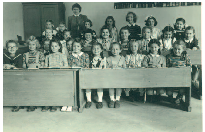
2. Elementarklasse A.