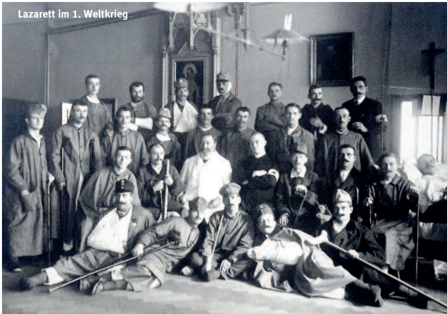
Lazarett im 1. Weltkrieg

nen, die jetzt in anderen Schulen weiter studierten. Allerdings wurden 1940 die Kongregationen verboten. Das Militär verlangte eine Erweiterung des Lazarettangebots, was aber aufgrund eines Vertrages auch finanzielle Erleichterung