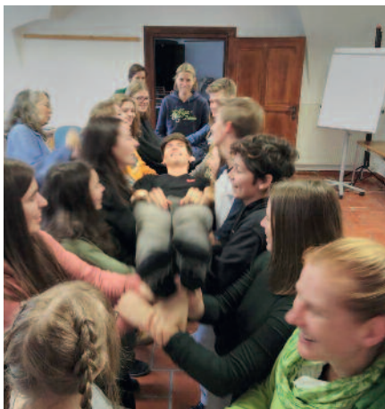
Übung zur Vertrauensbildung

„Peer-Mediation“ wird als unverbindliche Übung angeboten. SchülerInnen werden dazu ausgebildet, anderen Jugendlichen in Konfliktsituationen zur Seite zu stehen. Wichtig dabei ist, dass die MediatorInnen keine Lösungsvorschläge