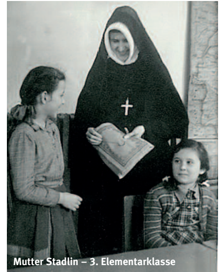
Mutter Stadlin – 3. Elementarklasse

Luftangriffen, dass eine Polizeiabordnung die Gemeinschaft zwingt, das Haus innerhalb einer Viertelstunde zu verlassen (Zeitzünderbomben in der Umgebung). Man kann sich unschwer vorstellen, was das für einige Schwestern, die das Haus sehr lange nicht verlassen hatten, bedeuten musste. So musste der Großteil der Gemeinschaft ins Konzerthaus, dem öffentlichen