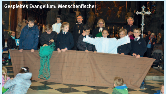
Gespieltes Evangelium: Menschenfischer